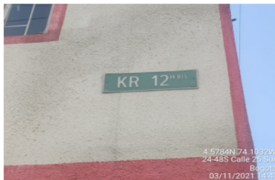
Foto 36. Nomenclatura de referencia